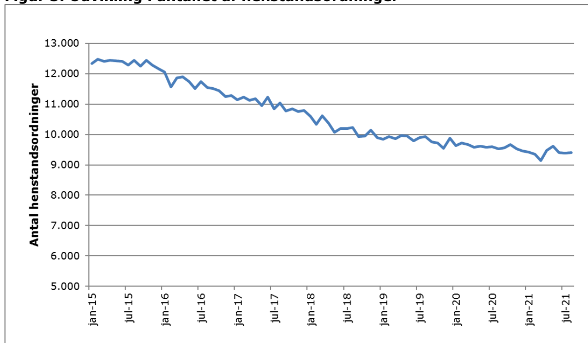
Figur 3. Udvikling i antallet af henstandsordninger